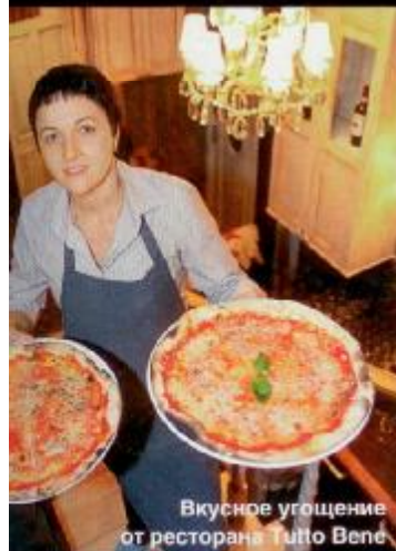
Вкусное угощение от ресторана Tutto Bene

Есть такое понятие «точный, как швейцарские часы». Впервые представленные в России часы марки Zenith — это не просто часы, но и знаковая вещь, предмет роскоши. Особенное внимание гости мероприятия обращали на модель часов «Последний царь» (Last Tsar) из коллекции Academy с двуглавым орлом на циферблате. «Стильно, красиво, дорого», — восхищались они, рассматривая витрины. И каждый втайне надеялся однажды появиться в свете с часами от Zenith.